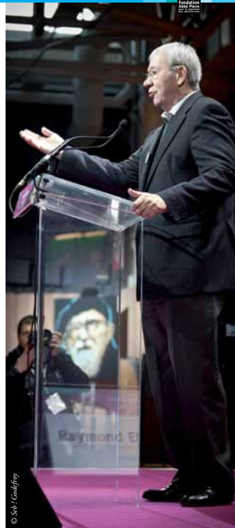
■ Raymond Etienne, président de la Fondation Abbé Pierre, lors de la présentation du rapport sur l'État du Mal-Logement, le 1 er février 2012

Raymond Etienne, Président de la Fondation Abbé Pierre