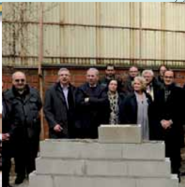
Alfortville : pose de la première pierre