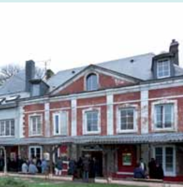
Esteville : La Halte et la chambre de l'Abbé

Deux lieux de vie en mémoire de l'abbé Pierre témoignent de l'attachement de ses fidèles à son combat : l'un à Esteville, en Seine-Maritime, et l'autre à Alfortville, près de Paris.